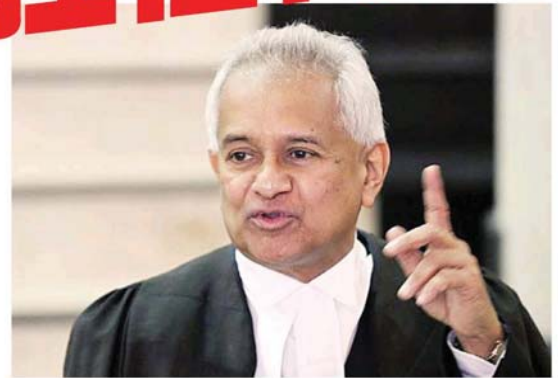
汤米汤姆斯: 3份报告皆指无法鉴定短片中的人士,因此,总检署不会提控任何人。

他指出,当局援引《刑事法典》第377B和377D条文调查本案,警方曾传唤数名证人确认案情,同时也逮捕和延扣了几名人士。