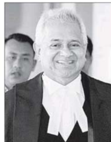
汤米汤姆斯 ▸ 总检察长