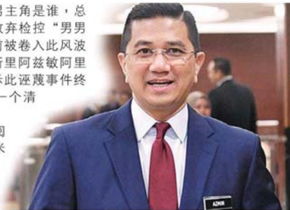
阿兹敏阿里: 诬蔑事件终于水落石出,还我一个清白。

最后,他呼吁大家一起遏止诬蔑政治文化、人身攻击及羞辱。“我们应该关注各种议题、理念、人民福祉和国家建设的课题。”#