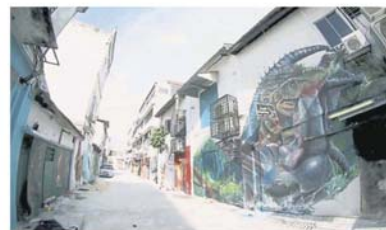
市议会在老街进行多项复兴计划, 包括在后巷绘上壁画。