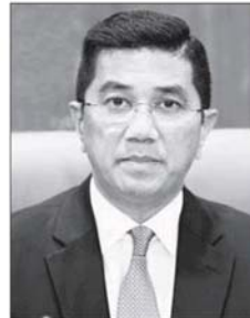
阿兹敏阿里 ▸ 公正党署理主席