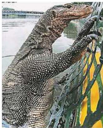
拦截垃圾浮台也引来蜥蜴“好奇”攀爬，让工作人员拍下这纪念性照片。