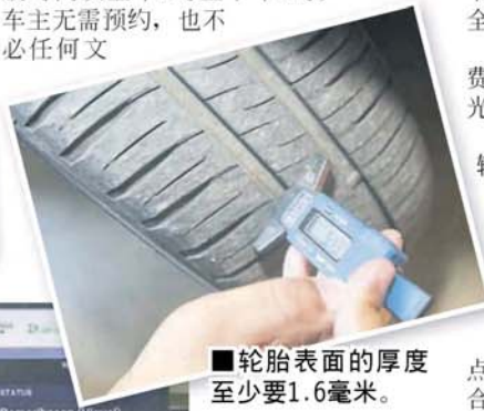
■ 轮胎表面的厚度至少要1.6毫米。