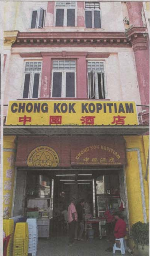
Chong Kok Kopitiam is a landmark in Jalan Station, Klang.