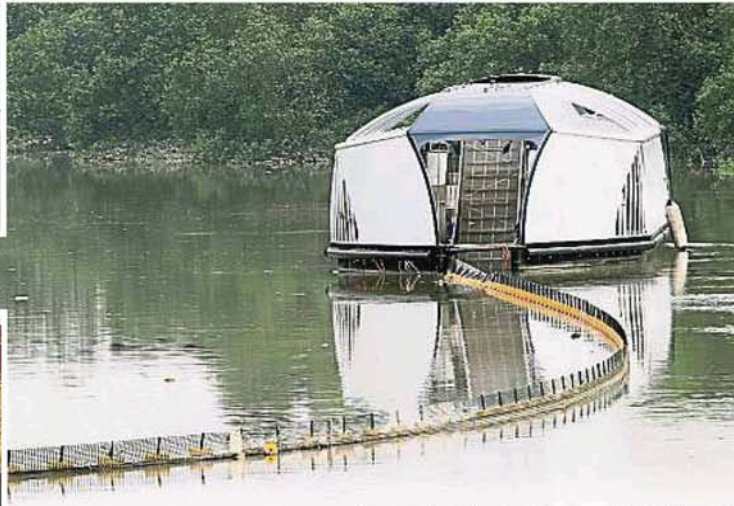
←拦截垃圾浮台仅在一个月之内就拦截35公吨垃圾，非常惊人!