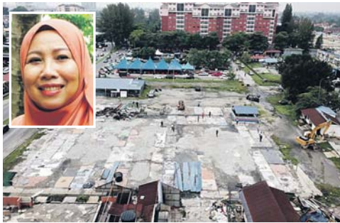
Tapak Uptown Puchong Permai yang terbakar sebelum ini telah dibersihkan oleh MPSJ dan akan dibangunkan semula untuk manfaat penduduk di kawasan berhampiran. Gambar kecil: Noraini