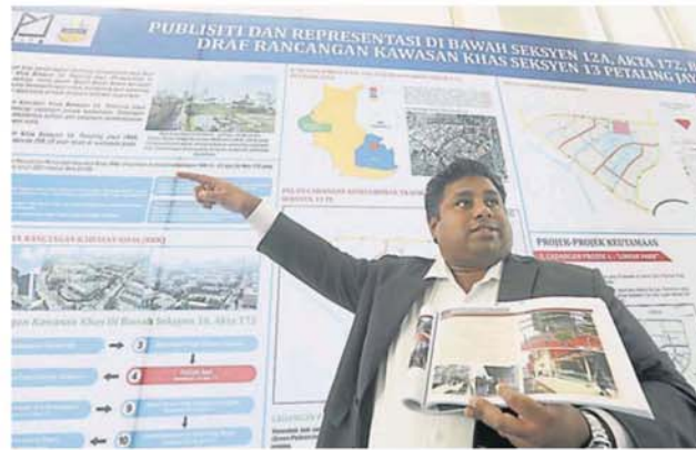
拉吉夫指八打灵再也13区计划打造成为亲民城市，建设衔接建筑物之间的人行天桥以方便民众步行。