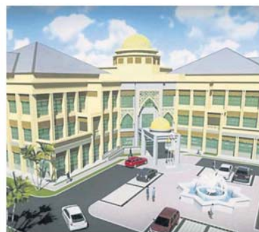
回教中心的概念图。

目前，公司其中一个大型承包项目是为雪兰莪政府建造位于瓜拉冷岳县的回教中心，预计将在明年年杪竣工。