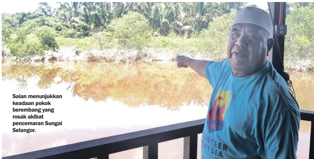
Saian menunjukkan keadaan pokok berembang yang rosak akibat pencemaran Sungai Selangor.

Tindakan buang sisa haram didakwa ancam habitat kelip-kelip