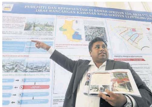
拉吉夫也展示市政厅的特别地区策劃藍圖(RKK)藍圖本。

他指出,这项策劃是为了改善区内的环境、设施,因在未来将有不少建筑计划在当地进行,故市政厅必须未雨绸缪,提前做好准备。