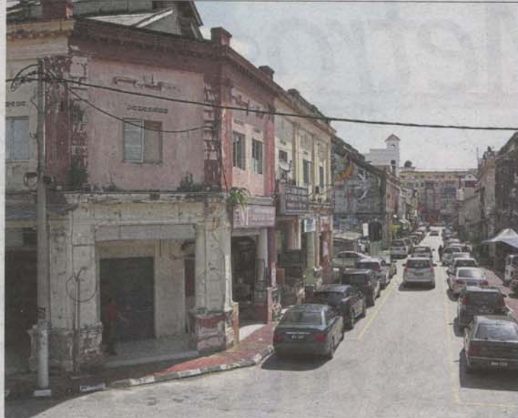
A view of Jalan Station 1 in Klang.