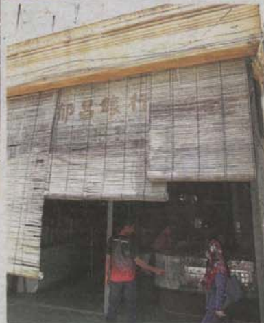
An old pre-war shophouse in Jalan Station 1.

Friday evenings and hope they will indulge in a staycation in Klang.