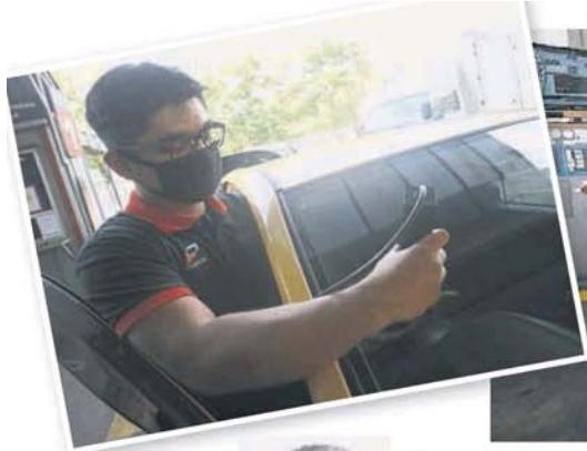
■ 专员检查车镜的透光度。

Provided for client's internal research purposes only. May not be further copied, distributed, sold or published in any form without the prior consent of the copyright owner.