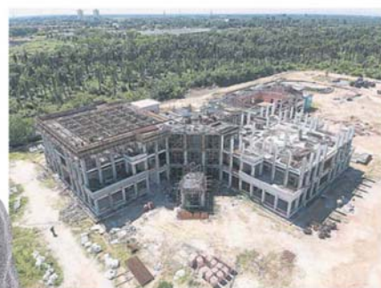
Abadi Ria 目前其中一个大型承包项目是为雪兰莪政府建造位于瓜拉冷岳县的回教中心，预计将在明年年杪竣工。