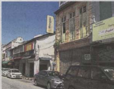
Some of the shophouses in Jalan Station 1 in Klang are rundown.

traders who can offer products that will convince people to make it their favourite place in Klang to visit on weekends.