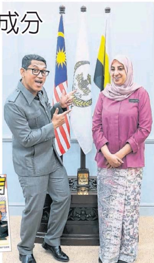
霹州大臣拿督斯里阿末法依扎(左)与拉蒂花合照，摆出鬼马动作。