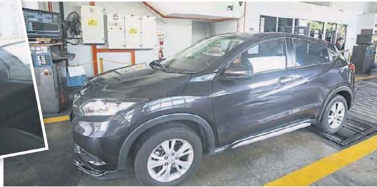
■ 确保汽车的性能是否安全。整个验车的服务大概15分钟，即可