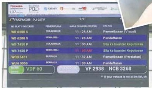
■ 开车服务。车主依照萤幕的指示展