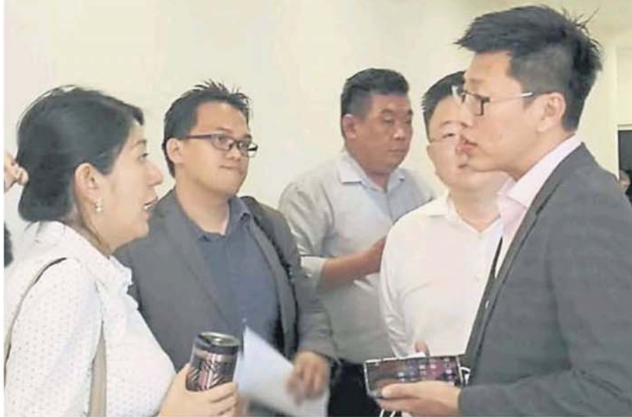
参与者向杨美盈（左）询问有关净电能计量政策。