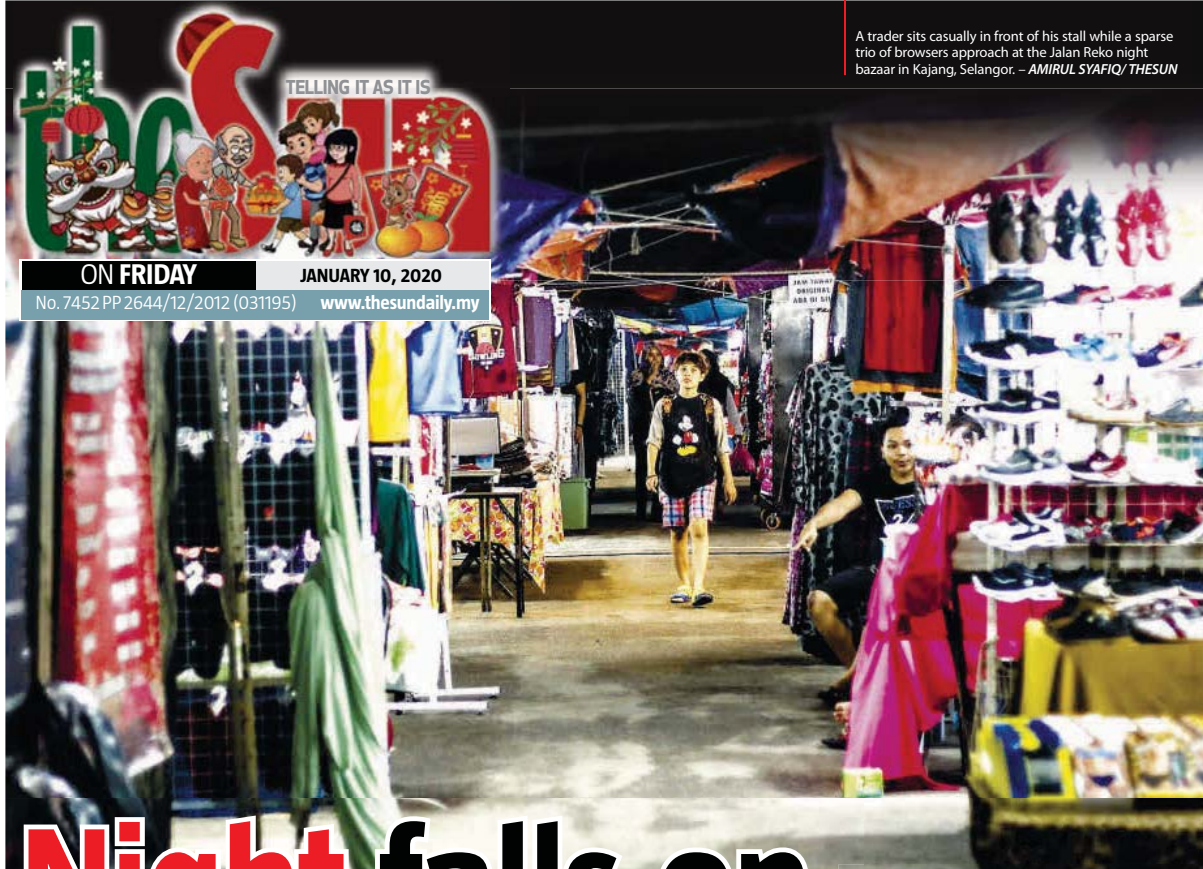
A trader sits casually in front of his stall while a sparse trio of browsers approach at the Jalan Reko night bazaar in Kajang, Selangor.