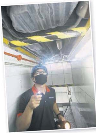
■ 专员进行车底检验。