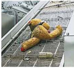
拦截垃圾浮台曾“拦截”大型玩偶!

Provided for client's internal research purposes only. May not be further copied, distributed, sold or published in any form without the prior consent of the copyright owner.